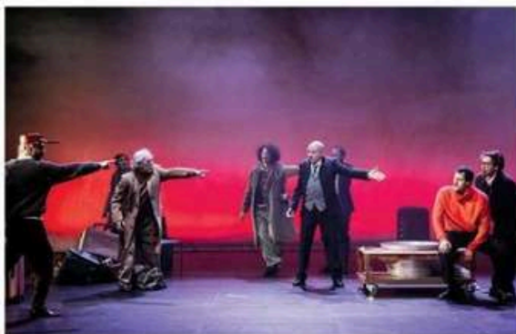
Le Mandat démonte les mécanismes des dictatures avec effronterie et truculence.