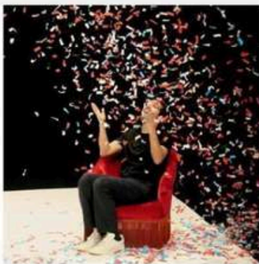
Seul-en-scène pour un dialogue interculturel.