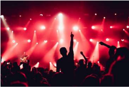
"Allumez le feu" de Johnny Halliday