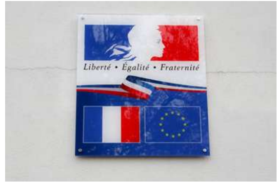
La devise "Liberté, égalité, fraternité"