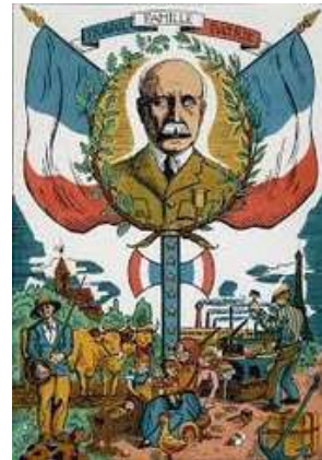
La devise "Travail, famille, patrie"