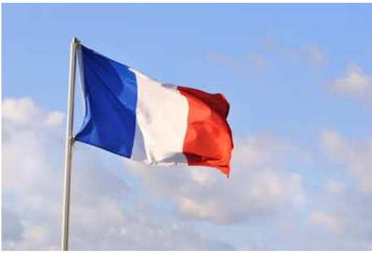
Le drapeau tricolore