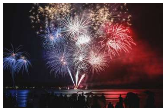
Le 14 juillet