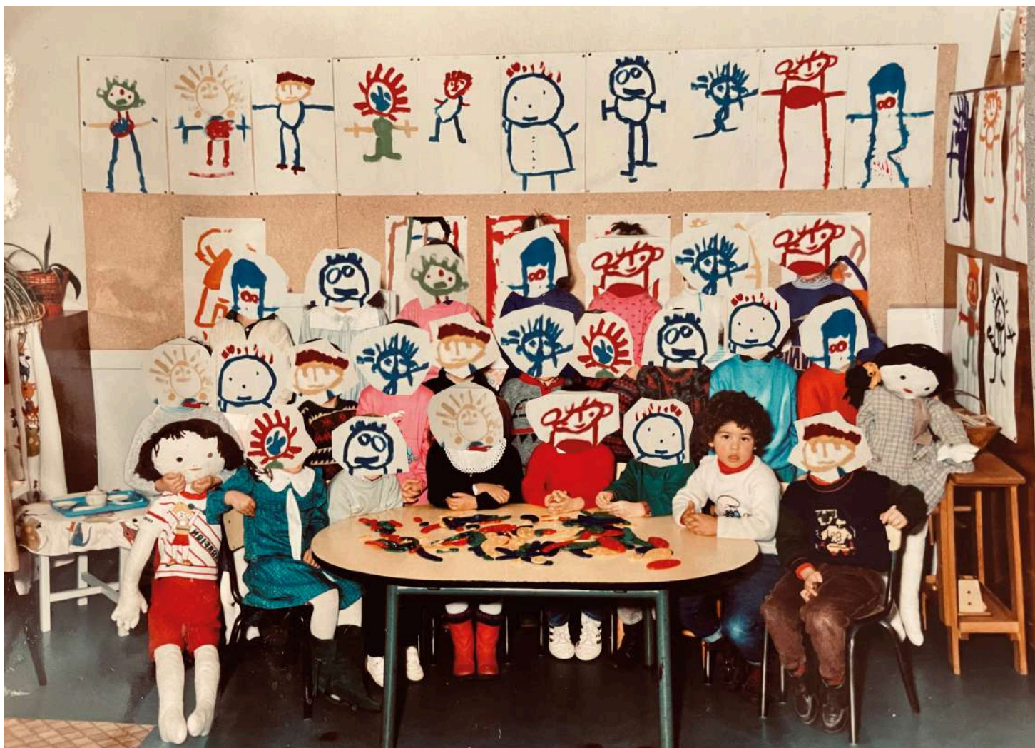
Ma République et moi , affiche du spectacle

Quel lieu est-il figuré sur l'affiche ? En quoi peut-il être considéré comme un emblème de la République ?