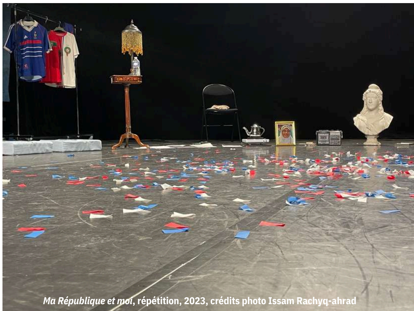
Ma République et moi, répétition, 2023

Dans l'image ci-dessous, retrouver les symboles de la République. De quelle couleur sont les confettis à la fin du spectacle ? Pourquoi ?