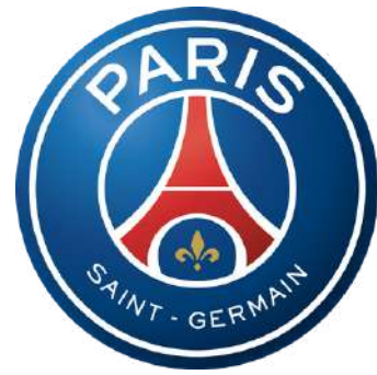
L'écusson du PSG