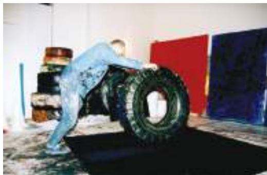
Le mythe de Sisyphe pousseur de pneu