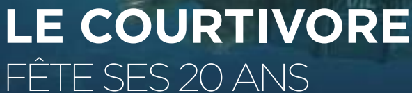
Illustration issue de Hybrids